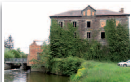
Ancien moulin d'Apigné : l'Université Foraine s'interroge sur l'avenir du bâtiment, son intégration dans le site et dans le quartier 9.

L'Université Foraine n'est pas un lieu mais une démarche qui vient d'une volonté de «faire avec» et non seulement de «faire pour». L'idée est de (ré-)associer les habitants d'un lieu à l'élaboration de leurs espaces de vie, de travail, de loisirs. Pour un