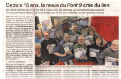
Merci à Ouest-France pour le très belle article en date du 08 mars 2019

À l'occasion de l'année de la Vilaine, la péniche spectacle s'amarrera à l'écluse Moulin-du-Comte. Montez à bord pour un spectacle en chansons et musique autour de l'univers de la batellerie. À partir de 8 ans / sur réservation