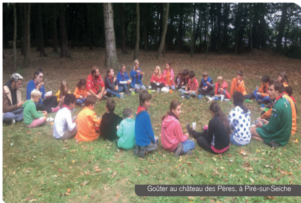
Goûter au château des Pères, à Piré-sur-Seiche