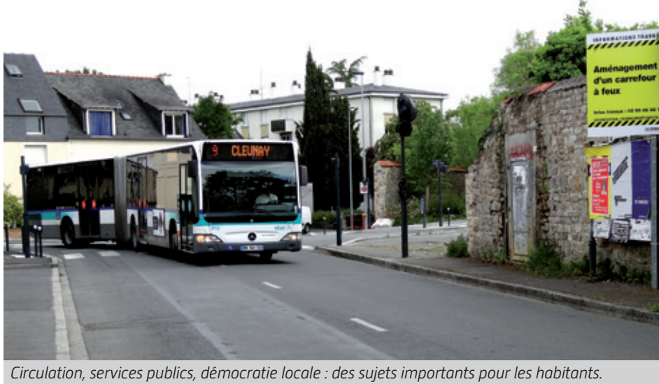
Circulation, services publics, démocratie locale : des sujets importants pour les habitants.