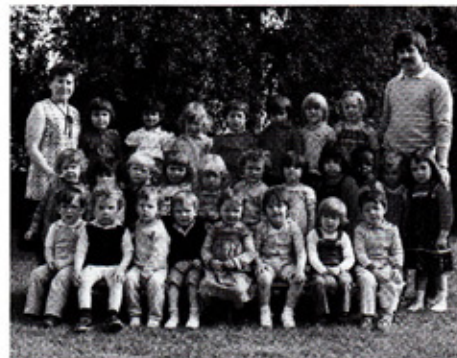
Petite Section de Maternelle en 82-83