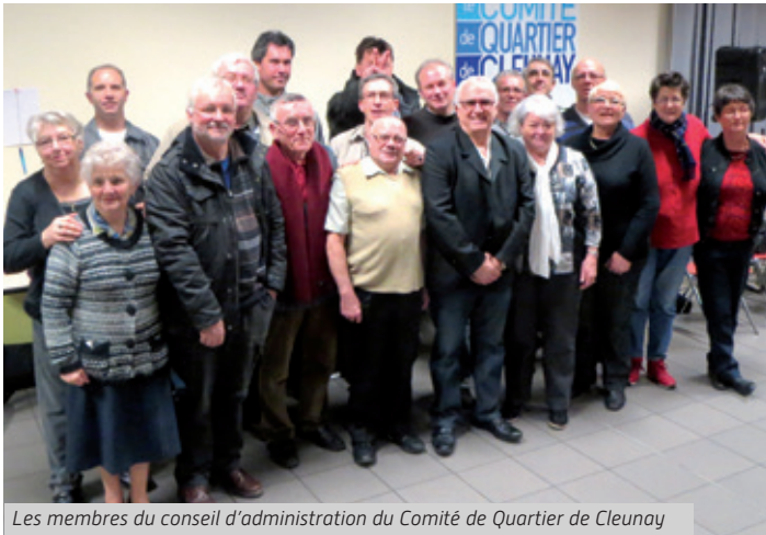
Les membres du conseil d'administration du Comité de Quartier de Cleunay