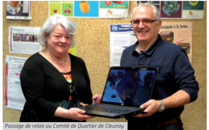
Passage de relais au Comité de Quartier de Cleunay