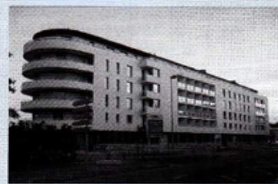
Le Central Plaza rue de Redon 61 appartements