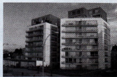
Le Belem quai de la Prévalaye 67 appartements