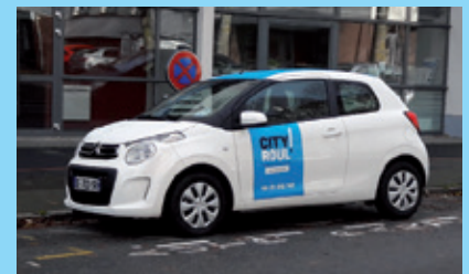
La Citroën C1 stationnée au centre de Cleunay face à la pharmacie

Renseignements sur www.cityroull.com ou au 02 23 210 747 & info@cityroull.com