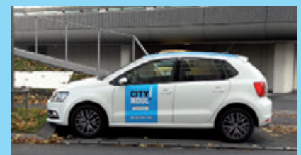
La Volkswagen Polo devant le Mabilais à Arsenal-Redon