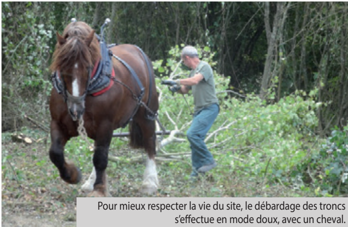
Pour mieux respecter la vie du site, le débardage des troncs s'effectue en mode doux, avec un cheval.

Pour quelles raisons ? Depuis plus de quarante ans, ces réserves foncières de la Ville de Rennes ont été dégradées par endroits. D'une part, des décharges sauvages s'étalent en surface aux dépens de la terre végétale et de l'écoulement des eaux ; d'autre part, certains arbres (saules, trembles...) prolifèrent plus rapidement au détriment d'autres espèces. Après l'arrêté du Préfet pris en octobre 2013, fixant le cadre légal des interventions, Rennes Métropole et la Ville de Rennes se sont entourées d'associations* compétentes. Elles ont élaboré un projet alternatif : il privilégie la biodiversité, rétablit les circulations naturelles des eaux, relocalise des productions alimentaires, tout en s'inscrivant plus largement dans les réflexions concernant la trame «Verte et bleue» le long de la Vilaine.