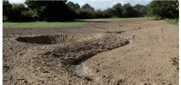
Avant les pluies, aménagements en pentes douces de fossés, selon la courbe du terrain, et d'une mare ; premiers effets à suivre au printemps prochain.

Développer une forêt durable, c'est effectuer une sélection sévère qui