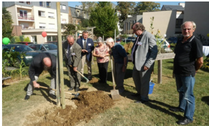
symboliquement un arbre de Judée fut planté au cours de la cérémonie

Rendez-vous l'année prochaine en novembre pour les 10 ans de l'EHPAD Lucien SCHROEDER.