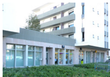
Bureaux DQO près de la poste de Cleunay