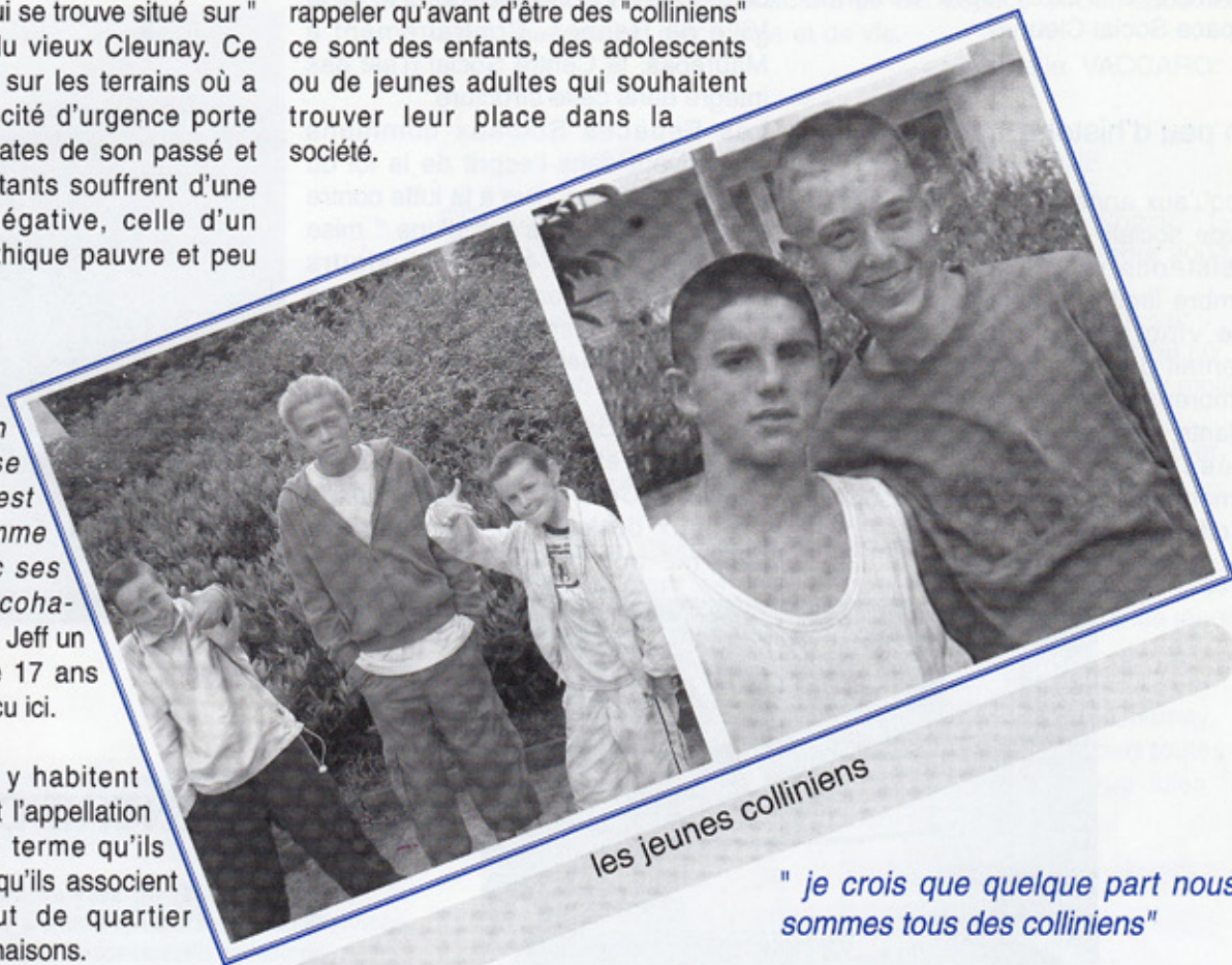
les jeunes colliniens

par cette petite phrase reprise par ce jeune habitant