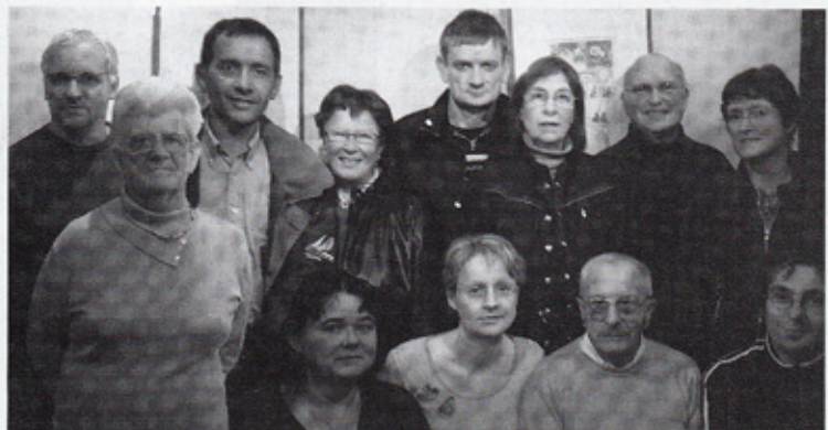
Une partie du comité de rédaction de votre journal