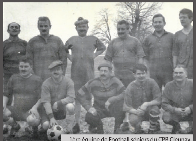
1ère équipe de Football séniors du CPB Cleunay