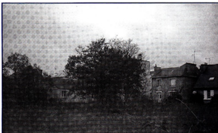
Le terrain de la future implantation, vu de la rue de Redon.

Si le calendrier est respecté, l'ouverture de cette maison de retraite est planifiée pour la fin de l'année 2005.