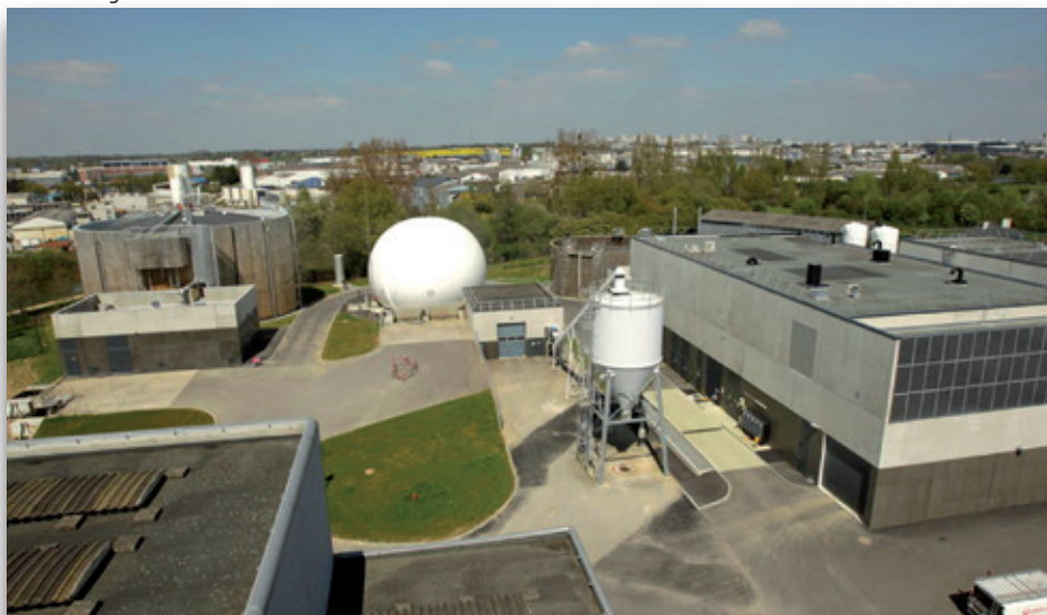
Sur cette vue, à droite le traitement thermique, au fond à gauche le digesteur et au centre au fond le gazomètre

Voici ce que nous avons retenu pour vous : ces nouveaux bâtiments sont vraiment réussis et s'intègrent parfaitement dans le paysage ; de l'extérieur, nous n'avons pas perçu de nuisances d'odeurs ou de bruits. Bonne nouvelle, l'usine valorise le Biogaz en produisant de l'électricité (environ 2 400 MWH / an) qu'elle revend à EDF. Elle produit de l'énergie thermique pour ses besoins et de l'énergie voltaïque. Pour les boues, elles sont hygiénisées et réduites en