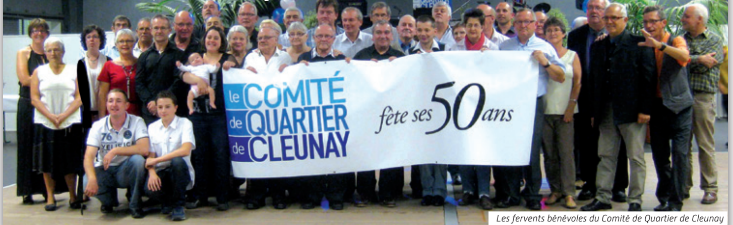
Les fervents bénévoles du Comité de Quartier de Cleunay