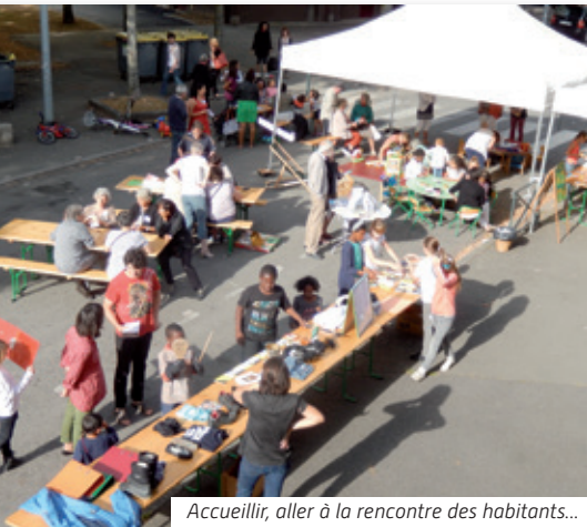
Accueillir, aller à la rencontre des habitants...

Début novembre, nous avons commencé à travailler ensemble à la réalisation de ce nouveau projet. Il devra répondre aux attentes et aux besoins des habitants. Nous avons près d'un an pour évaluer notre projet précédent, rencontrer les habitants et les partenaires avant de définir ce que seront nos priorités à venir.