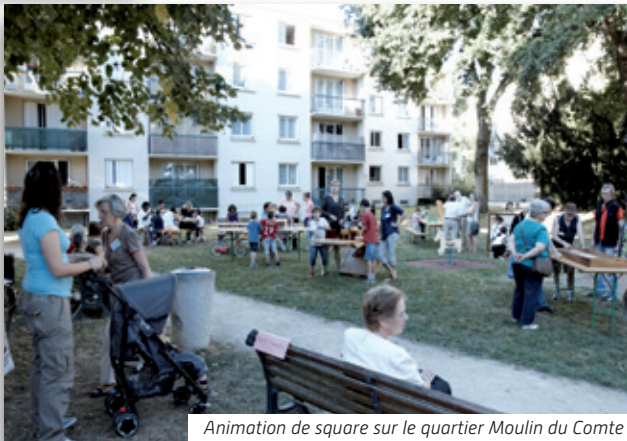
Animation de square sur le quartier Moulin du Comte

Il travaille avec les autres équipements du quartier pour répondre aux besoins des familles et à leurs