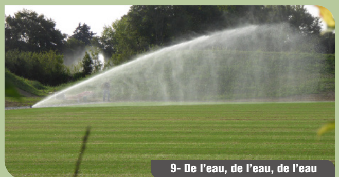
9- De l'eau, de l'eau, de l'eau