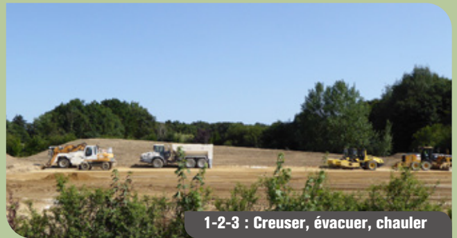
1-2-3 : Creuser, évacuer, chauler