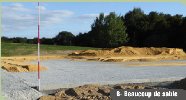
6- Beaucoup de sable