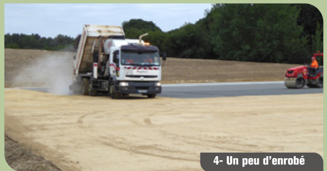
4- Un peu d'enrobé