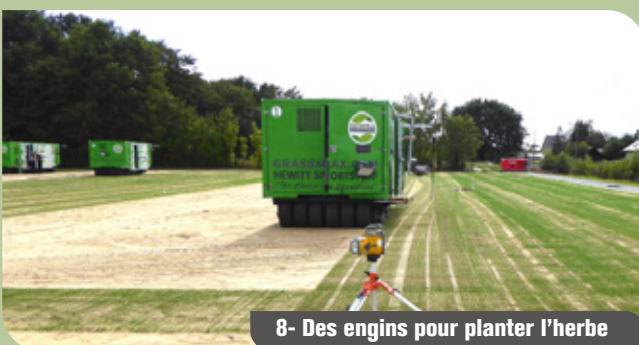
8- Des engins pour planter l'herbe