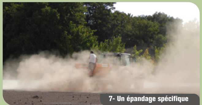
7- Un épandage spécifique