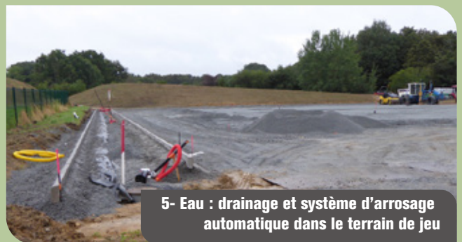
5- Eau : drainage et système d'arrosage automatique dans le terrain de jeu