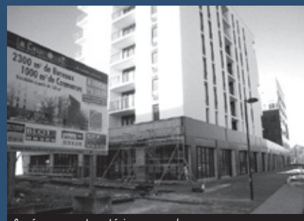
Aménagements extérieurs pour les nouveaux commerces

D'autres commerces seront prévus au cœur du quartier, le Pôle Courrouze, près du futur groupe scolaire.