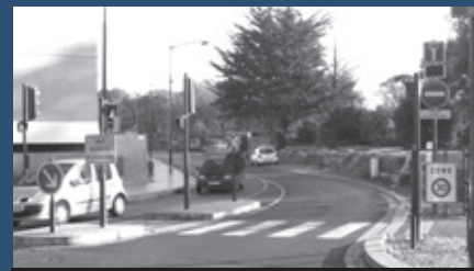
Rue Jules Verne nouveau trajet exclusif pour le bus n°6

La ligne de bus n°6 voit son trajet facilité pour joindre plus rapidement La Courrouze au centre-ville. A partir du lundi 7 janvier 2013, dans la rue Jules Verne, interdite aux voitures de passage, circulera le bus.