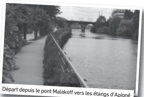
Départ depuis le pont Malakoff vers les étangs d'Apigné

La présence des beaux jours et l'arrivée des vacances d'été sont de bonnes occasions de courir et de marcher, à la découverte de ces parcours pour profiter agréablement des poumons verts de notre cité.