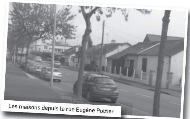
Les maisons depuis la rue Eugène Pottier

Ni eau, ni électricité, le confort minimum, sinon parfois l'eau à plus d'un mètre dans leurs habitations. Ces maisons sont toujours là mais depuis elles se sont améliorées et sont à présent équipées comme il faut. C'était au tout début du quartier de Cleunay, quand il n'y avait encore que des champs à perte de vue, avant que la Ville ne le rattrape.