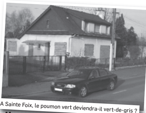
A Sainte Foix, le poumon vert deviendra-il vert-de-gris ?

Stade Rennais à La Taupinays (par ailleurs, chantier sans affichage informatif, sauf « interdit au public »).