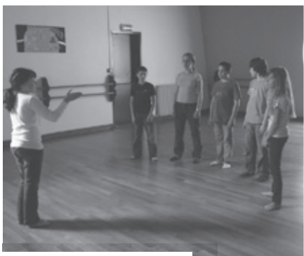
Théâtre des collégiens à la MJC

Les activités communes concernent surtout les élèves demi-pensionnaires sur le temps de midi : atelier Capoeira, atelier jonglerie, musique notamment autour du festival « Jeunes Charrues », danse et théâtre dans une salle de la MJC... Aline, assistante d'éducation et Johann, animateur à la MJC en assurent la coordination avec utilisation optimale des locaux des 2 équipements.